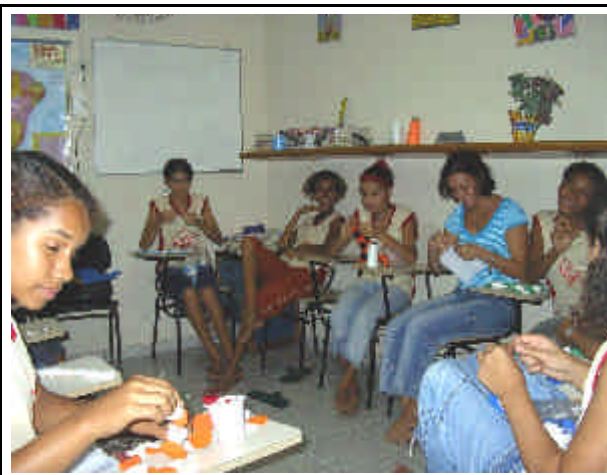
L'aula di rinforzo scolastico