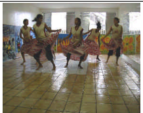
La sala danza con le nuove finestre