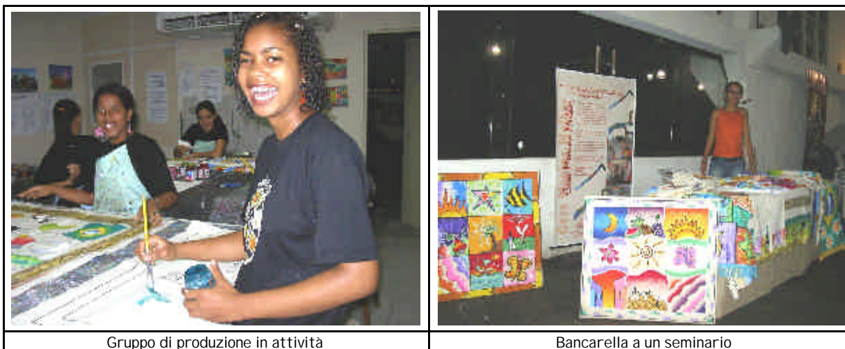
Gruppo di produzione in attività