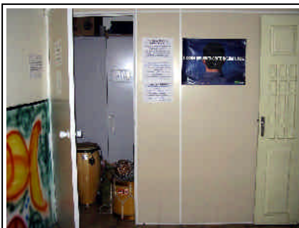
Il magazzino nella sala danza