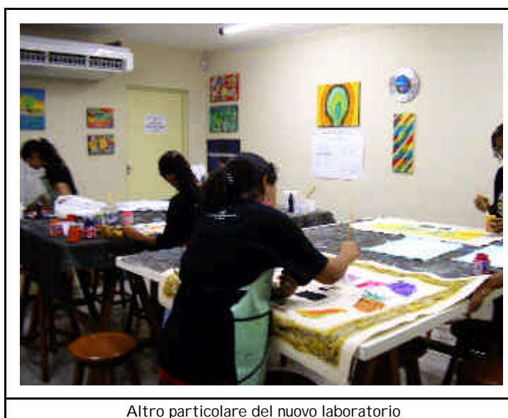
Altro particolare del nuovo laboratorio