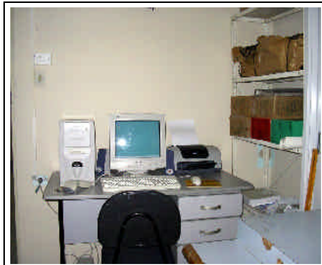
Un'immagine del magazzino

L'andamento delle vendite dei prodotti artigianali è praticamente duplicato.