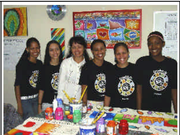
Le magliette del gruppo di produzione