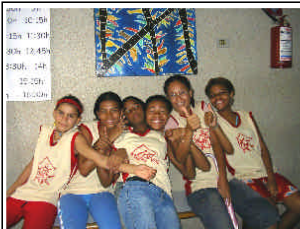
Ragazze con la nuova uniforme