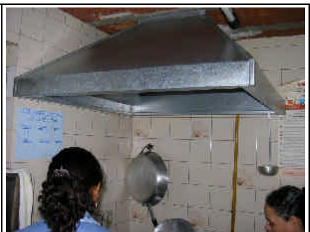
La cappa della cucina